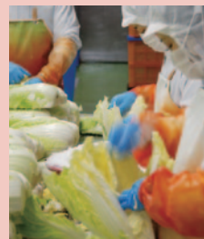
▲白菜キムチの塩振り

厳選した素材、原料のみを使用しています。白菜など原料となる野菜は、国内の契約農家で栽培したものを使用。「仕入れたものを、常に職人の目で厳しくチェックし、厳選して使う」これを愚直に続けていくことが、お客様の「美味しい」につながると考えています。