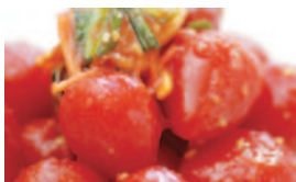
果実みいたなトマトベリー