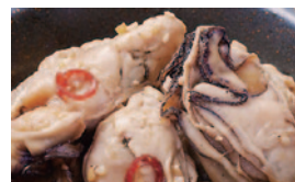
蒸し牡蠣の生姜醤油漬