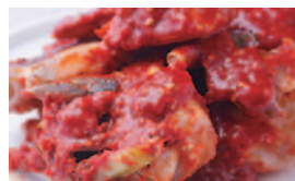
ケジャン (カニキムチ)